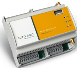
Smart Base Server LR