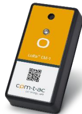
CM-1 Node/Sensor LR